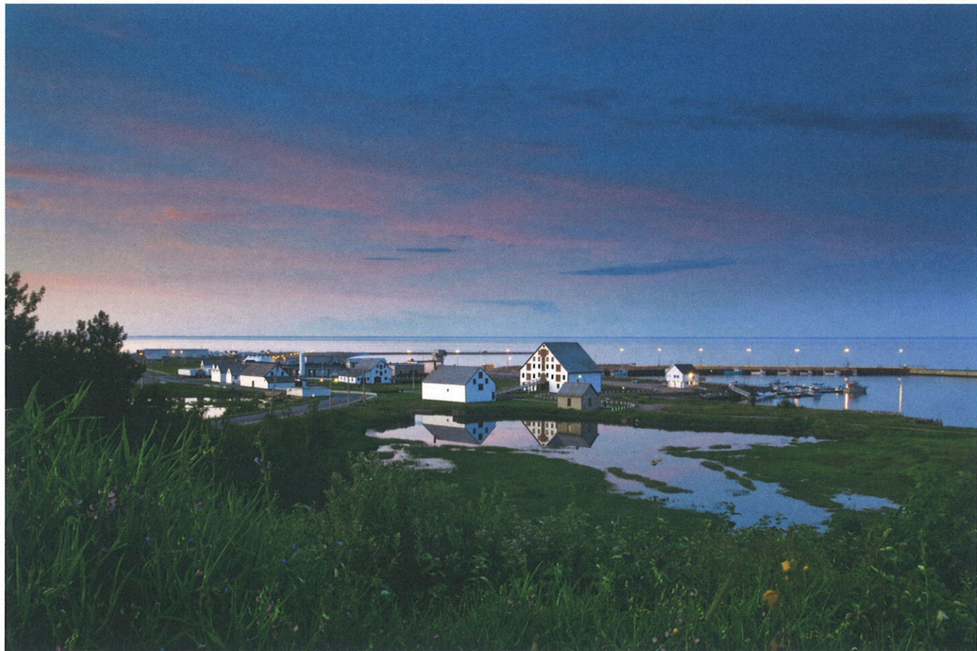
En-dessous : . Ci-contre : .

En bas : L'original est l'un des animaux emblèmes du Canada. Aurez-vous la chance de croiser son chemin dans le parc national de Gaspésie ?