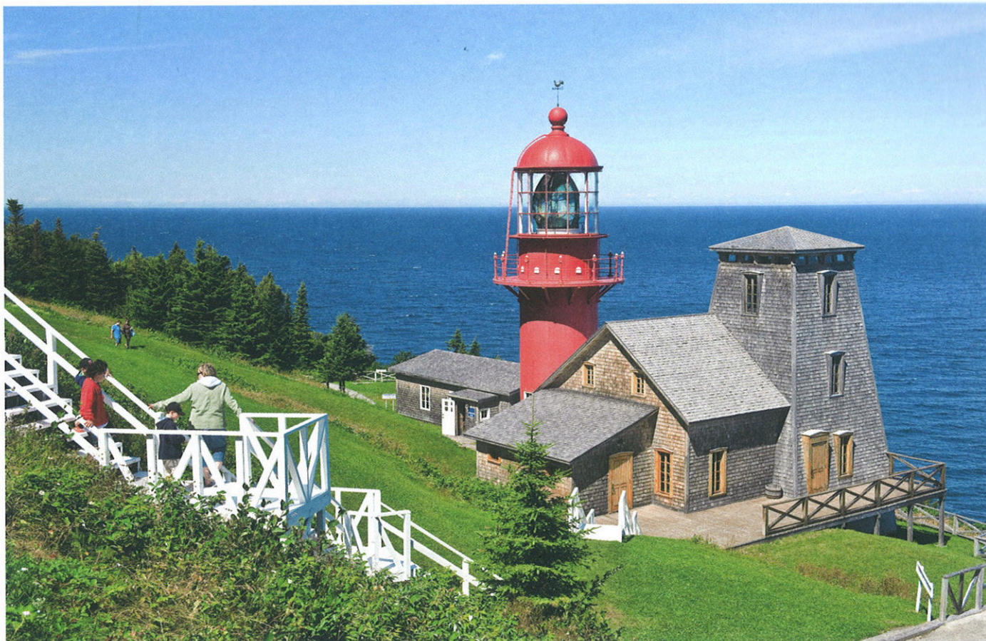
Ci-dessus : Phare centenaire de la Pointe-à-la-Remommée rapatrié en 1997 après 20 ans d'exil à Québec.