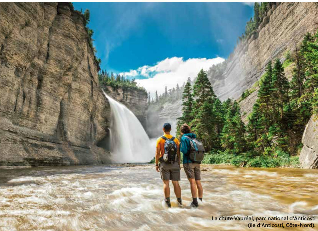
La chute Vauréal, parc national d'Anticosti (île d'Anticosti, Côte-Nord).