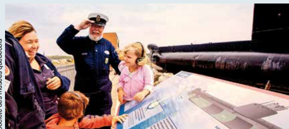
© Robert Barone / Société des musées québécois